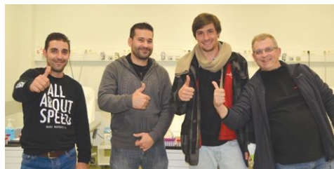
Grupo José Pimenta Marques