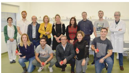
Câmara Municipal de Braga

Durante o mês de novembro, a Câmara Municipal de Braga, a Cachapuz, a LK-Comunicação e o Grupo José Pimenta Marques voltaram a disponibilizar parte do seu tempo para vir até ao Banco de Sangue do Hospital de Braga. Estas empresas bracarenses têm sido assíduas nas suas dádivas e têm feito com que diferentes grupos de colaboradores das suas empresas tenham oportunidade de fazer a diferença na vida de alguém. A solidariedade corre-lhes nas veias. Obrigado a todos por se juntarem a esta causa!