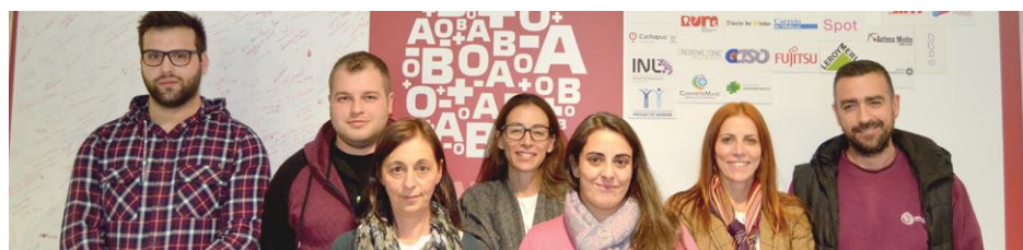
Grupo José Pimenta Marques