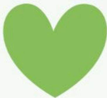
Coração Cuidado, Afeto