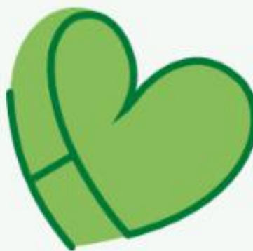
Iniciais do Hospital de Braga